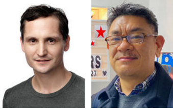
演出 シュチェパーン・パーツル 日本語字幕翻訳 広田敦郎